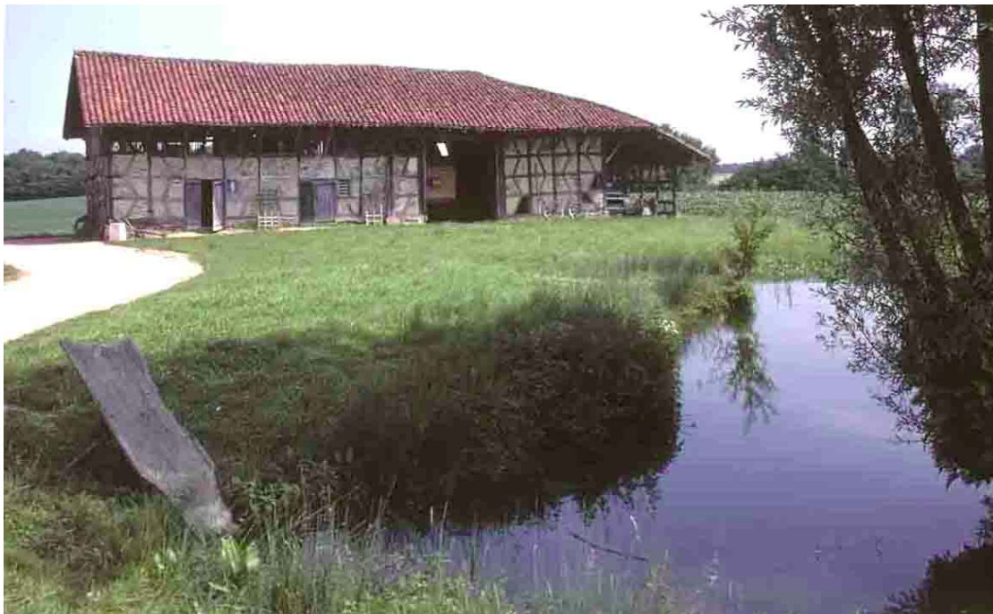
Courtes, l'écomusée de la Forêt (Ain), 1985, la mare, en Bresse, représente bien souvent le site d'extraction de l'argile, ayant servi à la confection du torchis.