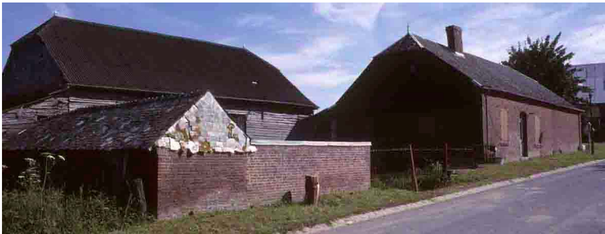
Il est de même évident que le bâtiment, à droite, est le corps de logis qui lui correspond. La grange se situe en retrait, en fond de cour, mais avec la même orientation que la maison.