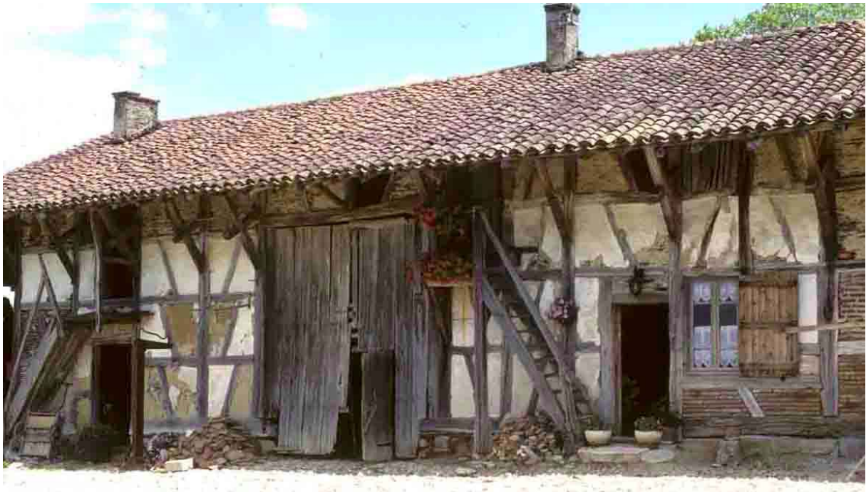
Petit-Montrachy (Ain), 1995. Une maison bressanne à plusieurs logis, d'un côté, encore du torchis, sous un enduit ; de l'autre, de la brique en remplissage. Pourquoi ce passage du cru vers le cuit (une règle universelle) a-t-il été ici sélectif ?