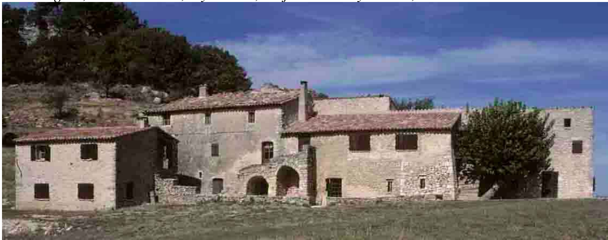
Le Castelllas, près de Sivières (Vaucluse), 1990, comme un « super mas Théotime ».