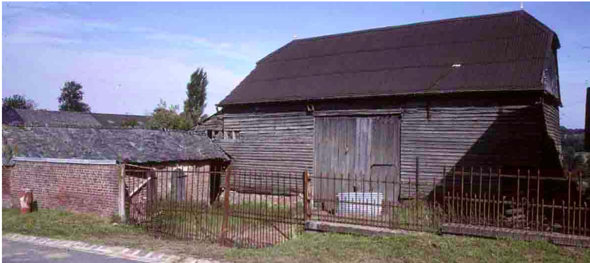
Bancigny (Aisne), 1997, son allure identifie sans mal cette grange-étable.