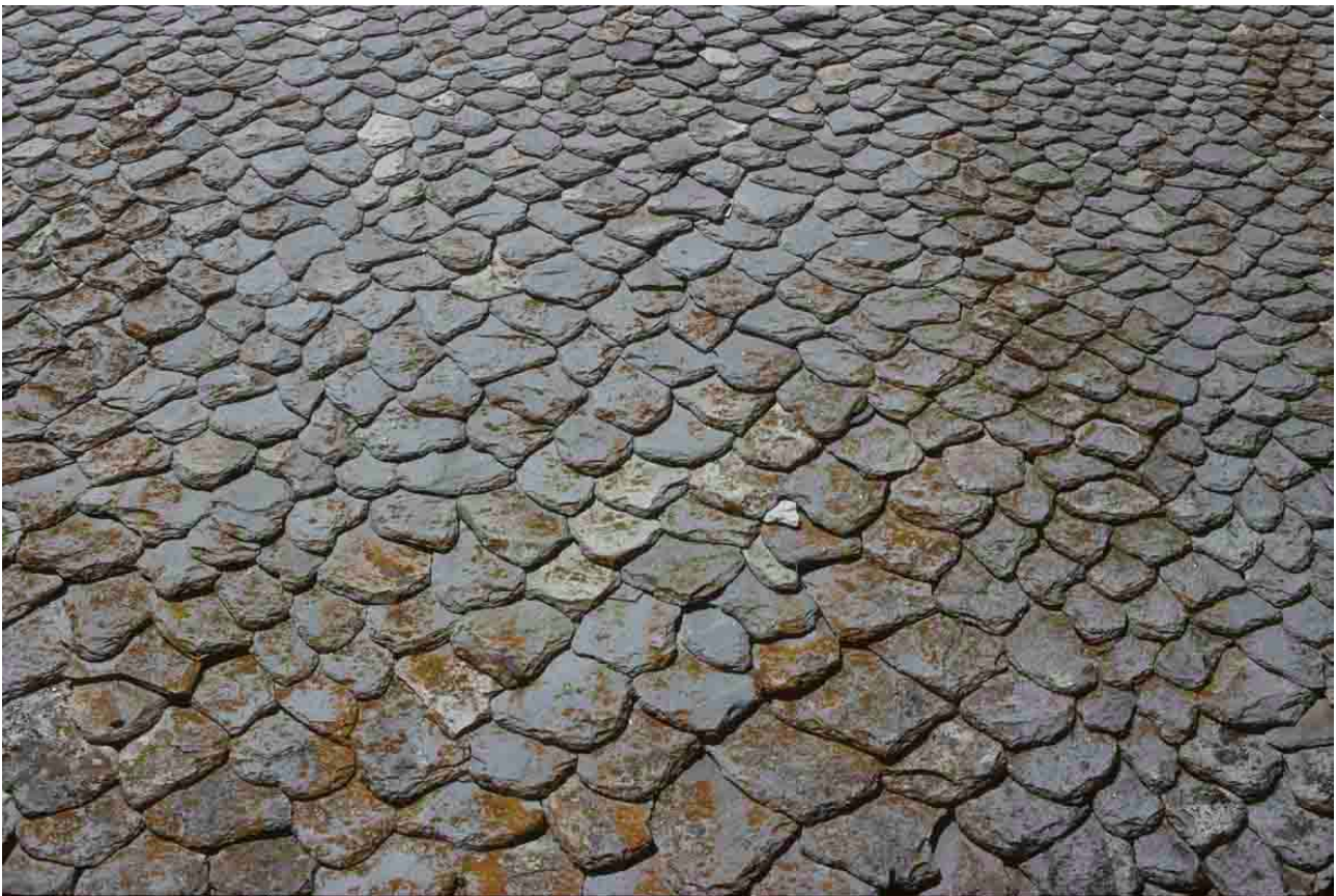
Alberoches (Cantal), 1996, toiture de schiste en écailles serrées.

La phonolite du Cantal se met en place sur des charpentes à couples de chevrons formant ferme, espacés de 70 à 80 cm. La pose des lauzes s'effectuait autrefois à la cheville de châtaignier, elle l'est aujourd'hui, au clou. Il existe des lauzes à trou unique en forme de poire et des lauzes à encoches latérales, en forme d'écusson. La lauze de micaschiste adopte les caractères précédents mais son format plus réduit lui permet de suivre les mouvements de la toiture, autorisant les levées: coyaux, lucarnes, outeaux.