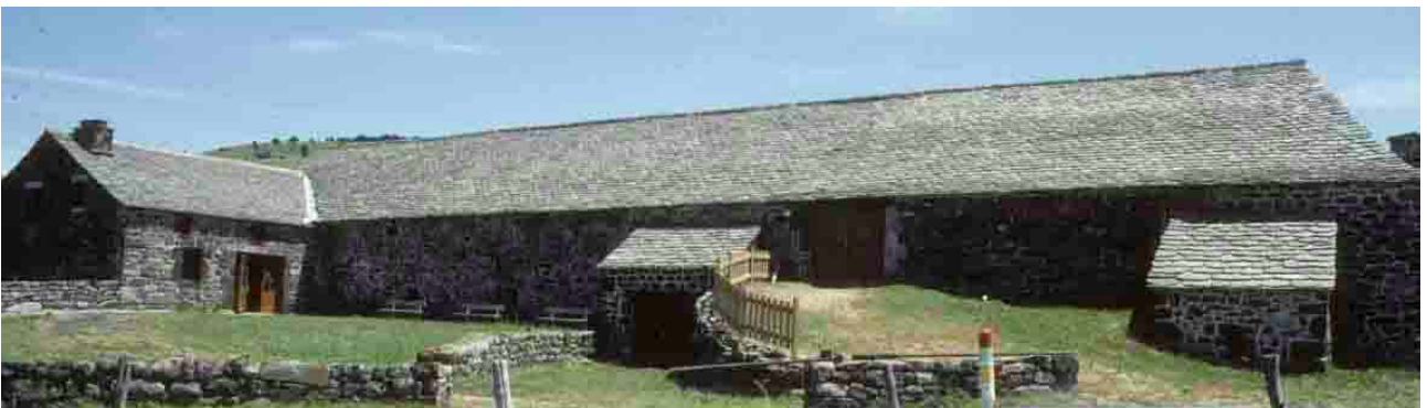
Bourlatier (Ardèche), 2003.

Le Larzac et le Causse Noir se sont largement ouverts à la tuile creuse à la fin du siècle dernier. A l'est, la pierre fait son apparition un peu avant le Pont-de-Monvert. Si l'on trouve toutefois de la tuile creuse entre Genolhac et le Pont-de-Monvert, la pierre reste bien présente sur les hauteurs immédiates. Au nord-est, son apparition se produit à mi-versant des Cévennes ardéchoises, à la hauteur des Vans, de Bardejan à Aujac ou de Paysac à Saint-Jean-de-Pourcharesse.