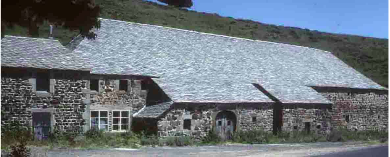
Le Béage le Pré-aux-Bœufs (Ardèche).

Ilot du Mont Mézenc: ses frontières passent par le Puy, Yssingaux, Tence et Saint-Bonnet-le-Froid au nord; Saint-Andréol, la Chapelle-sous-Chanéac, Saint-Angrève à l'est, Usclades et Rieutord, le Béage au sud; Moudeyres, à l'ouest.