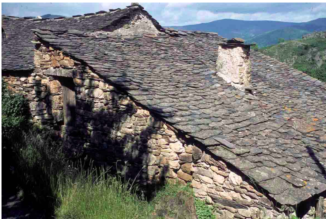
La Borie (Lozère), 1977.

N 584, apparition nette de la tuile creuse entre Saint-Germain-de-Calberte et Saint-Etienne-Vallée-Française.