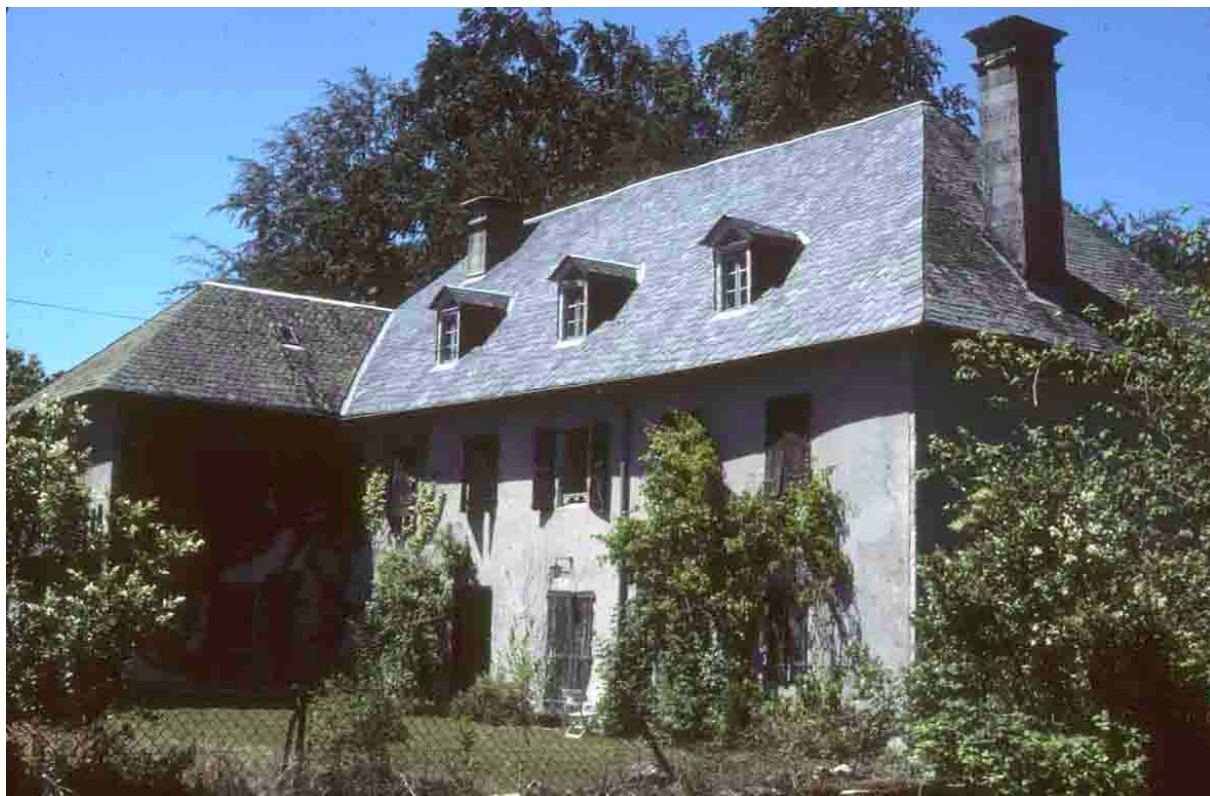
Jeux (Corrèze), 2004.

N 120, transition entre ardoise écaille et ardoise droite au niveau de Forgès, N 121, au niveau de Beynat.