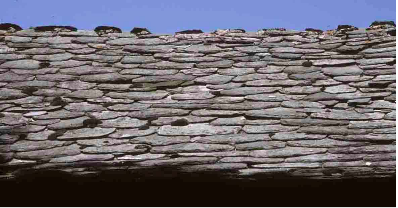
Chanteloube (Haute-Loire), 1994.

En Haute-Loire, la mise en œuvre de la lauze s'adapte à l'épaisseur et à la fragilité des matériaux, à la pente du toit, à la pluie et à la neige, aux vents dominants. Dans le pays d'Yssingeaux, par exemple, elle s'effectue sur un mortier d'argile souple, parfois battue au fléau. Sur le mont Mézenc, la plus forte pente de toiture impose au contraire leur clouage par chevilles de bois ou clous d'acier forgés. Devant l'impossibilité de percer la lauze sans la briser, on crée deux encoches latérales dans sa partie supérieure et on cale les plaques de lauze avec de la mousse ou du foin.