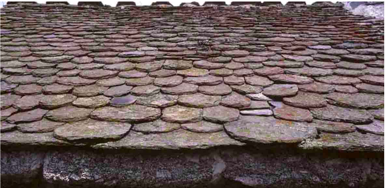
Les Lauzies (Lozère), 1985.

Auparavant, les lauzes auront fait l'objet d'un tri par le couvreur, venu les chercher à la carrière. L'étalonnage s'effectue de 0,20 à 0,60 cm, avec un madrier gradué tous les 2 cm et les lauzes de même longueur sont mises en pile. Celles qui excèdent 60 cm sont réservées aux saillies du toit, et les plus minces servent aux jouées des lucarnes. Comme il se doit, le couvreur débute par les gouttiers, avec des lauzes d'égout faisant de 0,70 x 0,50 cm, puis il ajuste le rang de rive avec un cordeau mis en débord de 15 cm. Il tire ensuite au cordeau traceur (cordex) sur le rang de gouttiers, une ligne située au tiers inférieur des pierres, de manière à ce qu'elle passe en dessous des trous de fixation. La base de chaque lauze du rang supérieure viendra s'y placer.