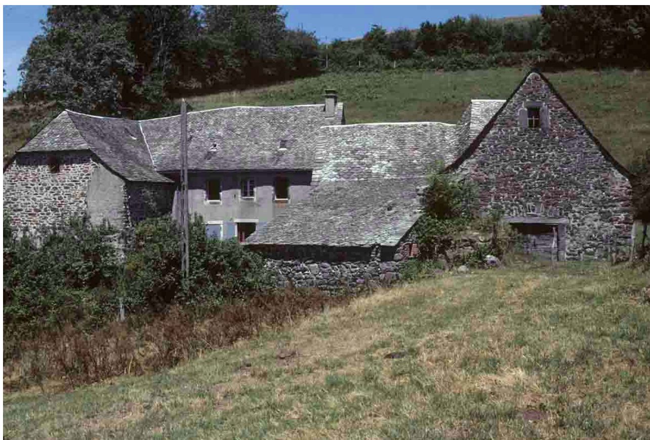
Les Bassets (Aveyron), 2010.

N 122, D 58, D 45, traces de tuile creuse à Saint-Mamet-la-Salvetat, Roannes-Saint-Mary, Prantignac.