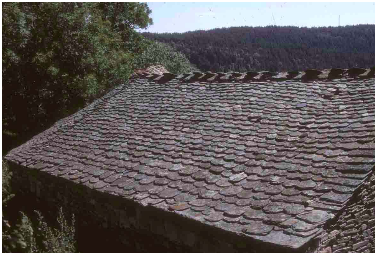
Le Oultet (Lozère), 1994, comme l'égout, la rive, en bas à droite, est faite de grandes lauzes droites.

Dans le Cantal, ou les lauzes de rive sont portées par un chevron de rive situé en retrait de 10 à 15 cm par rapport au nu du mur, ou elles le sont à nu du mur, recouvertes par une ardoise débordante de 2 à 3 cm et protégée latéralement par un essentage d'ardoises clouées.