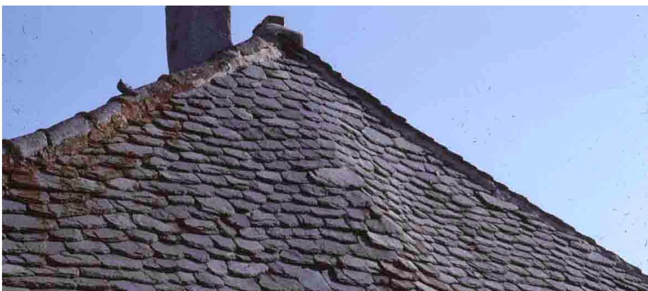
Fay-sur-Lignon (Haute-Loire), 1994.