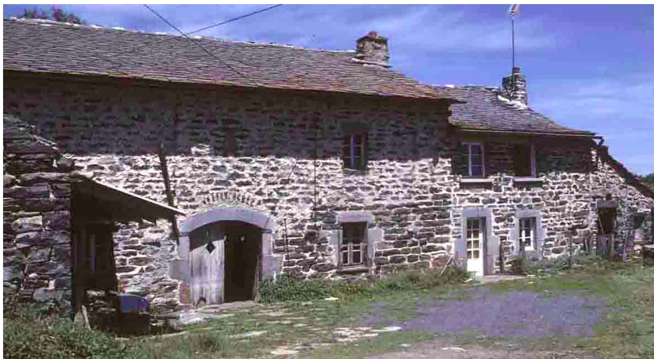
Bélistard (Haute-Loire), 1985.

D 71, apparition rapide de la pierre entre Laubarnès et Cheylard-l'Evêque. D 36, transition au niveau de Laussonne. D 38, entre Vachères, Mézeyrac et Issarlès.