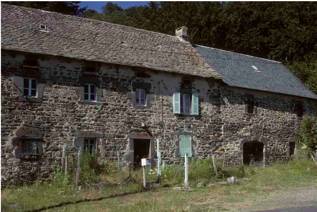
Vins-Haut (Puy-de-Dôme), 1996.