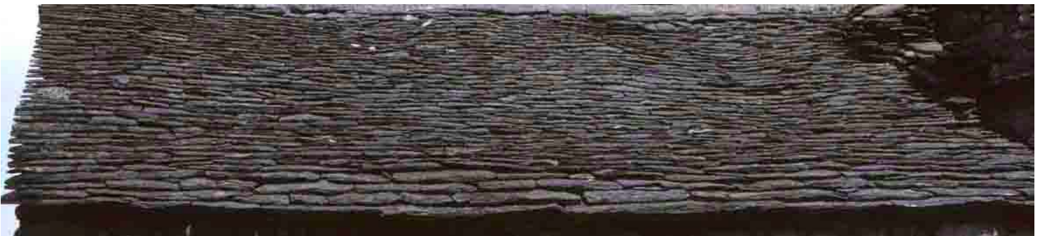
L'Espinas (Ardèche), 1994.

En Ardèche, la lauze de schiste s'accorde à des pentes moyennes de toit de 37 à 40°, mais elle nécessite des charpentes, normes de fayard ou de hêtre. Les fermes sont seulement espacées de 1,20 à 1,40 m. pour supporter un poids de lauzes d'épaisseur de 2 à 3 cm, peuvent atteindre de 0,60 à 0,70 cm de taille. Nécessairement plus important que sur les toits à forte pente, le recouvrement s'effectue aux deux tiers, avec un pureau d'un tiers. La pose réclame un platelage de hêtre fruste, sur lequel les lauzes sont clouées ou le plus souvent, retenues par des chevilles de bois. Mais dans les Cévennes ardéchoises, les lauzes sont placées sur un platelage de châtaignier, avec un lit d'argile, procédé également courant en Margeride et en Aubrac.