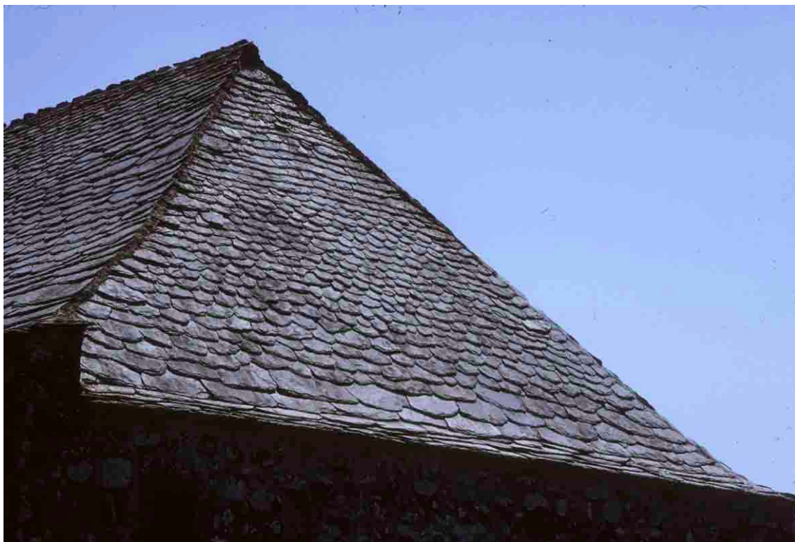
Deux-Rabbes (Haute-Loire), 1994.

D 26, D 101, apparition de la tuile creuse à Chambons-Haut.