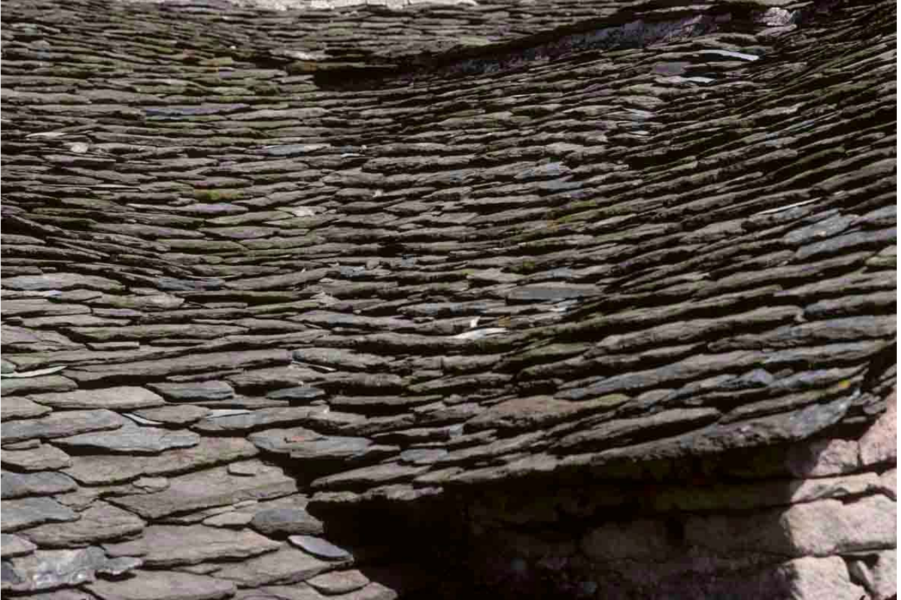
L'Espinas (Ardèche), 1994, belle noue sur toit de micaschiste.

En Ardèche, le mont Gerbier-de-Jonc servit de carrière de phonolite avant de devenir un site de rendez-vous touristiques ; non loin, en Haute-Loire, la dernière carrière exploitée fut celle du Lac bleu, près du Mégal, et il serait aujourd'hui question de la rouvrir. On trouvait également de belles carrières à Chaudeyrole et au Signon.