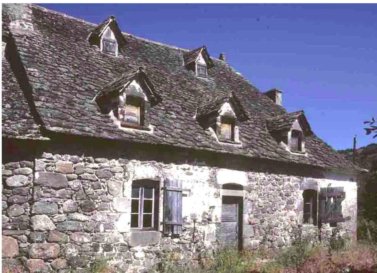
Bagnac (Cantal), 1985.

D 23, panachage tuile pierre jusqu'à Celoux.