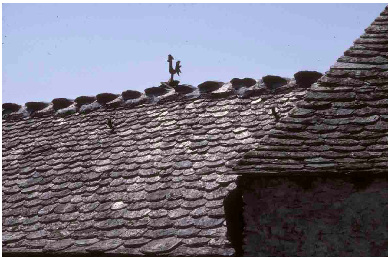
Le Oulet (Lozère), 1994, une toiture qui s'éveille au chant du coq.

Les couvertures de montagne donnent la préférence à ces matériaux naturels que sont le bois, du fait de la présence de forêts abondantes, et la pierre, en raison de la prodigalité des sols en minéraux. Les différents matériaux pierreux de couverture s'adaptent à la géologie ambiante, c'est ainsi qu'on utilise les laves - pierre de Volvic ou phonolithe - dans les secteurs des volcans du Cantal et de Haute-Loire, alors que le schiste prédomine pour le reste: schiste grossier plus ancien dans le Cantal, schiste ardoisier d'extraction plus récente dans le Cantal et dans l'Aveyron. Toutefois l'îlot du Massif central ne se circonscrit pas strictement aux contours du massif, les Limagnes ont favorisé la pénétration de la tuile creuse sur presque toute la superficie du Puy-de-Dôme, tandis qu'au sud, la pierre, calcaire cette fois-ci, s'est répandue sur la majeure partie des grands causses, exception faite de celui du Larzac, où se partagent les zones d'influence respectives du calcaire et de la tuile creuse. La frontière est mieux tranchée entre le Rouergue et l'Albigeois par exemple ; il suffit parfois d'y passer d'un village à l'autre pour changer de matériau de couverture, comme aux environs de Villefranche-de-Rouergue.