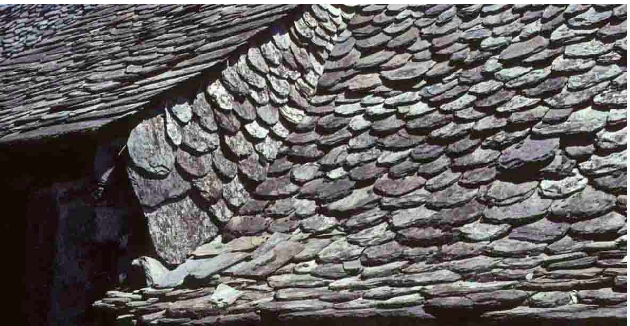
Linans (Aveyron), 2010, arêtier débordant et noue coupée d'auvent de grange.