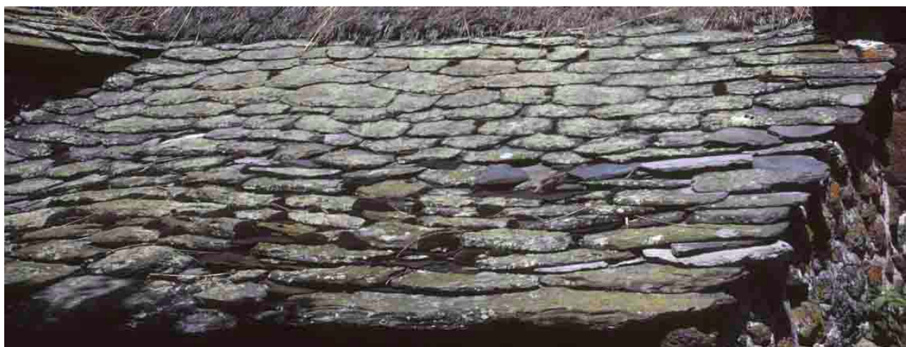
Moudeyres (Haute-Loire), bordure en phonolithe sur toit de chaume.