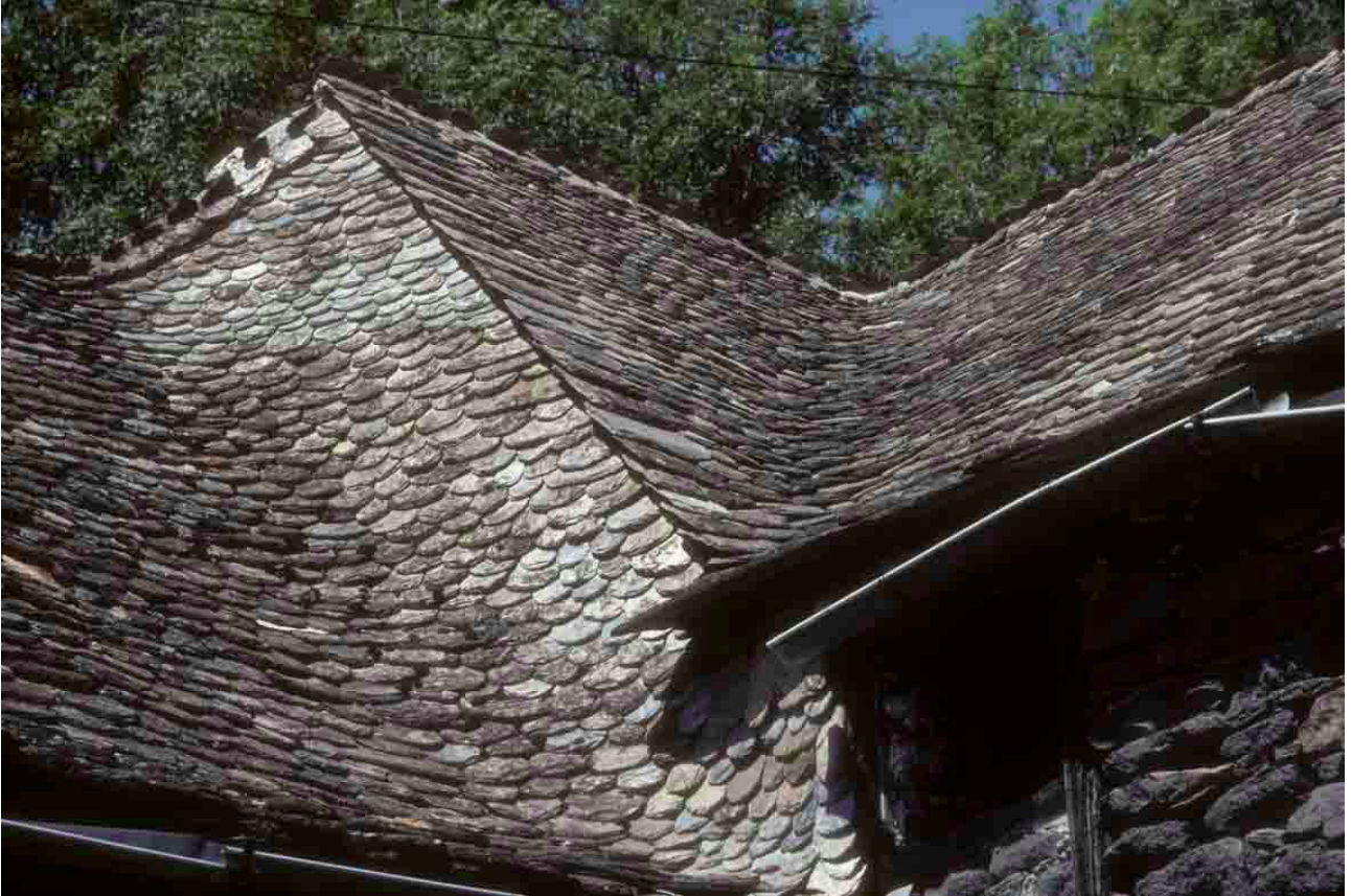
Prades d'Albrac (Aveyron), 2002, remarquable succession de deux noues autour d'un arêtier, avec un fâitage en rastel.

Elle est en arrondi, avec des lauzes taillées en trapèze. La largeur des noues de ce type de toitures permet la création de noues reliant parfaitement les deux versants, sans rupture.