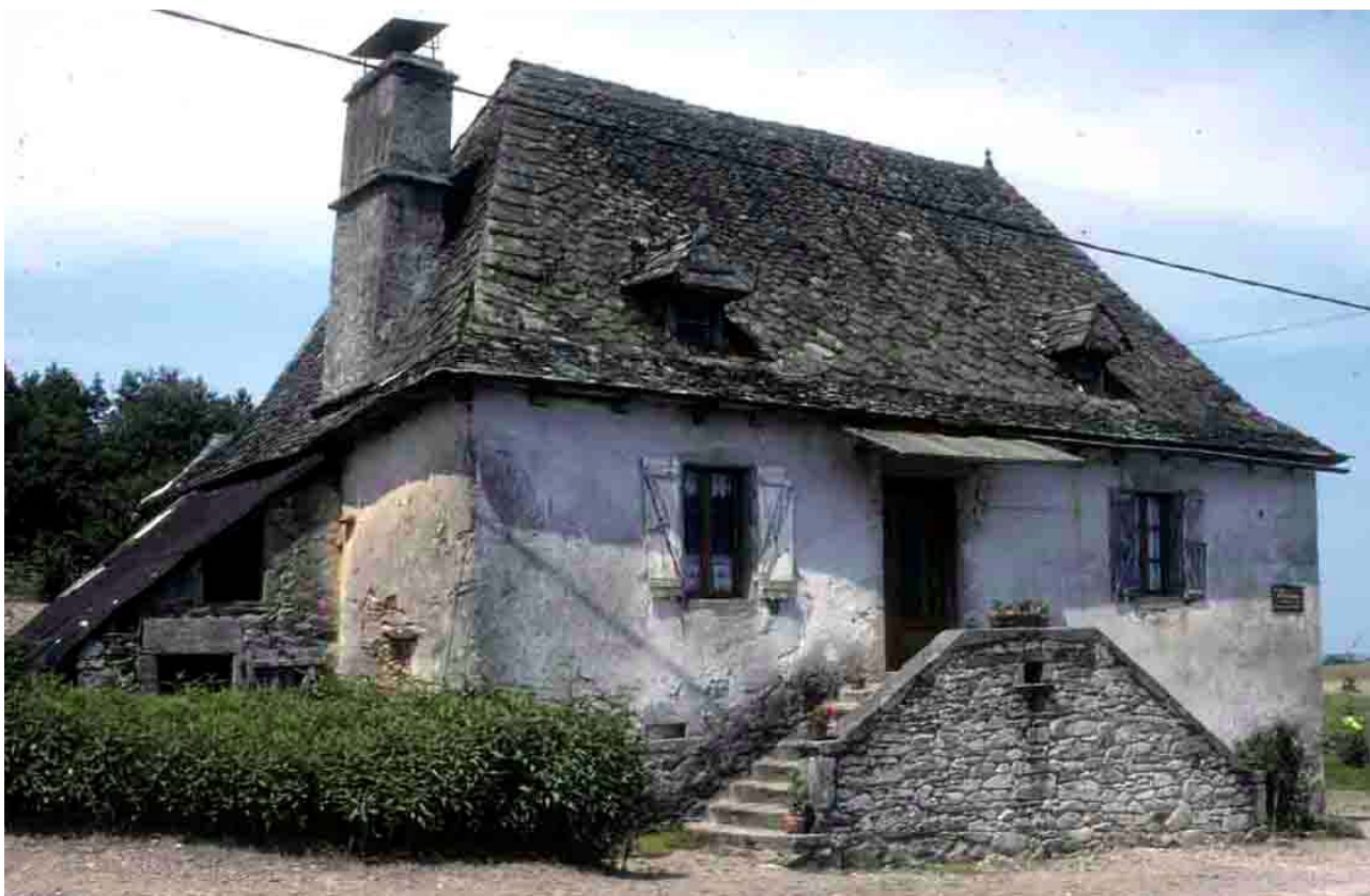
La Vialle (Corrèze), 1997. Maison limousine, de type cantalien.

D 23, transition nette à Rouillas et Ponteix.