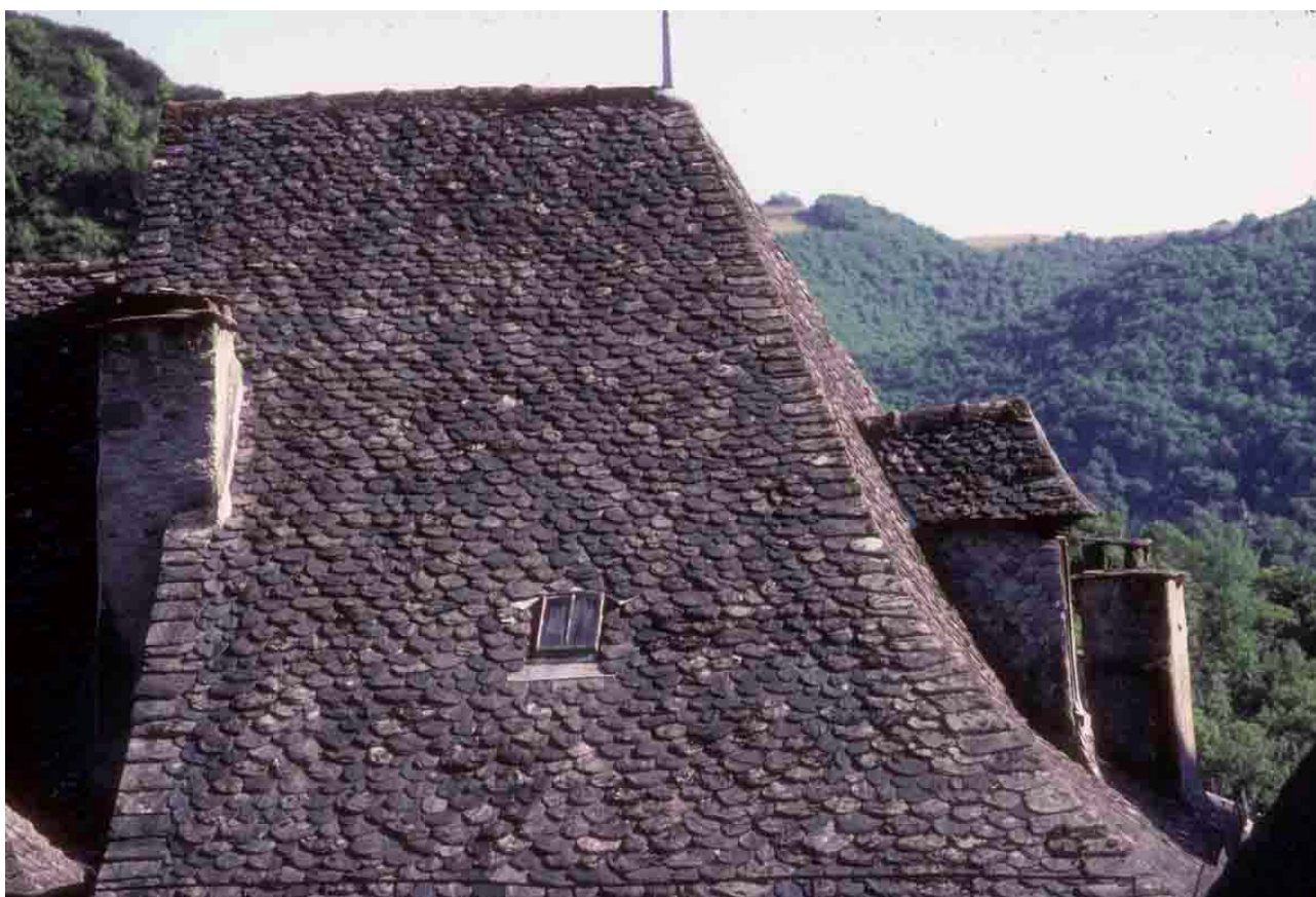
Conques (Aveyron), 1998.

D 47, transition entre la Salvetat et Mazérolles, pierre de tuile creuse. Au nord de Villefranche de Rouergue, surtout de la tuile plate.