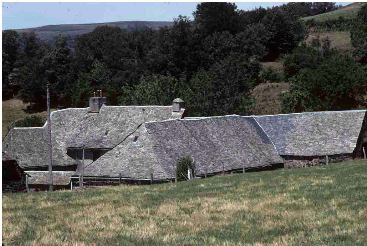
Les Bassets (Aveyron), 2010.

D 168, entre Aguessac et Saint-Germain, prédominance de la tuile mais encore de la pierre.