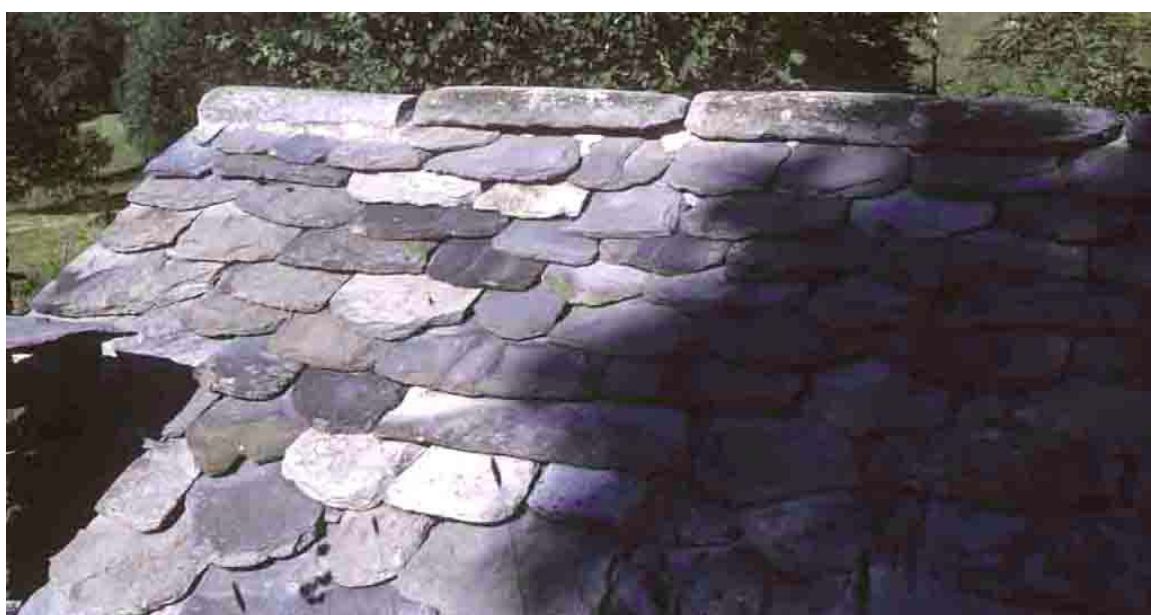
Cancoules (Haute-Loire), faîtage en bastel.

En Lozère, le faîtage en lignolet consiste dans le débordement des lauzes opposées aux vents dominants.