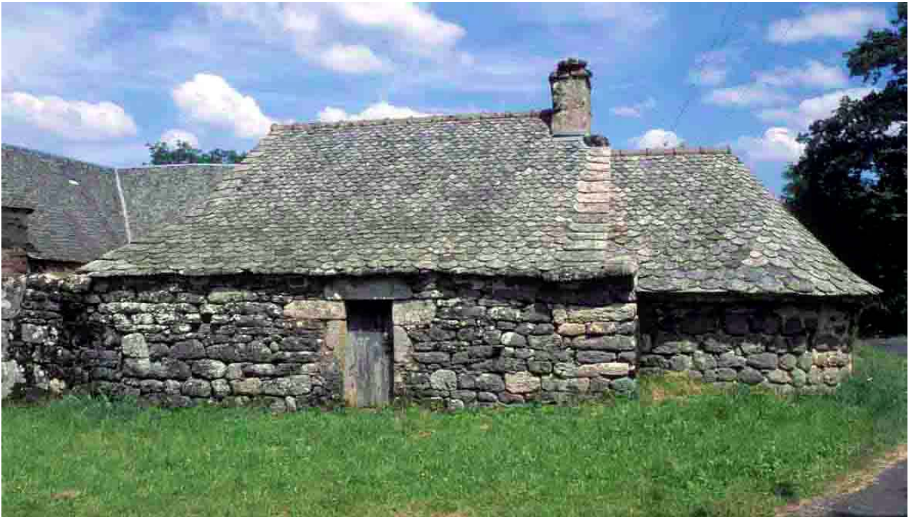
Cayrac (Aveyron), 2012, le four à pain, une construction très minérale.