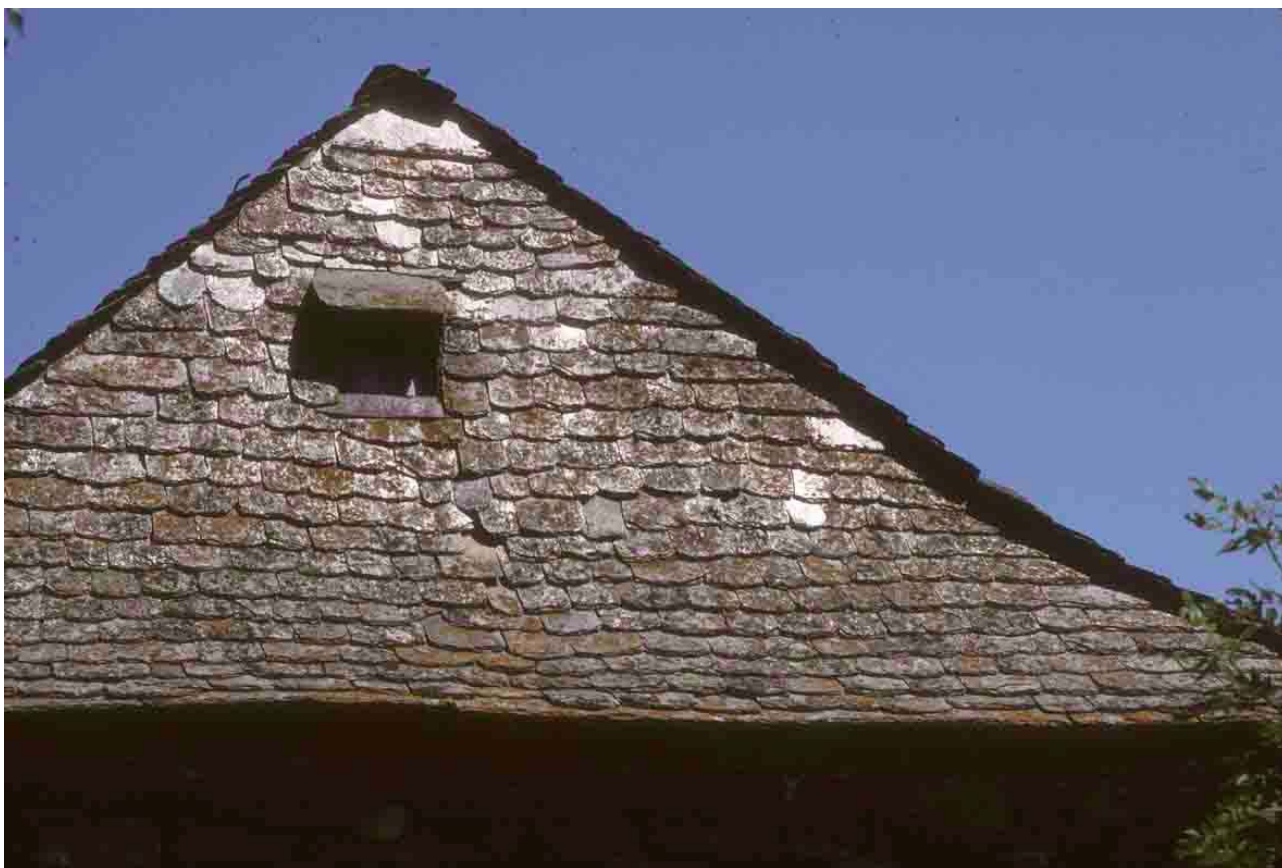
Le Oultet (Lozère), 1994, deux arêtiers faits de lauzes débordantes.

Sur les pignons au vent, les pans latéraux font saillie avec un joint de glaise ou de mortier.