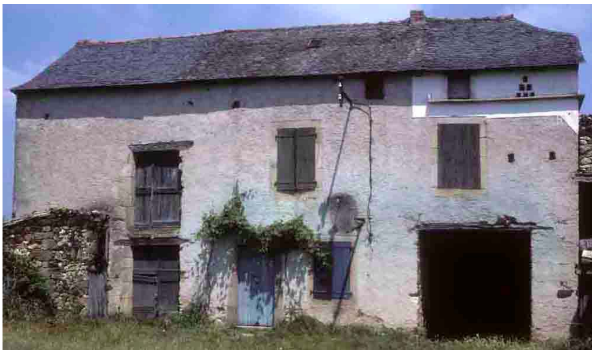
Saint-Martin Laguépie (Tarn), 1985.