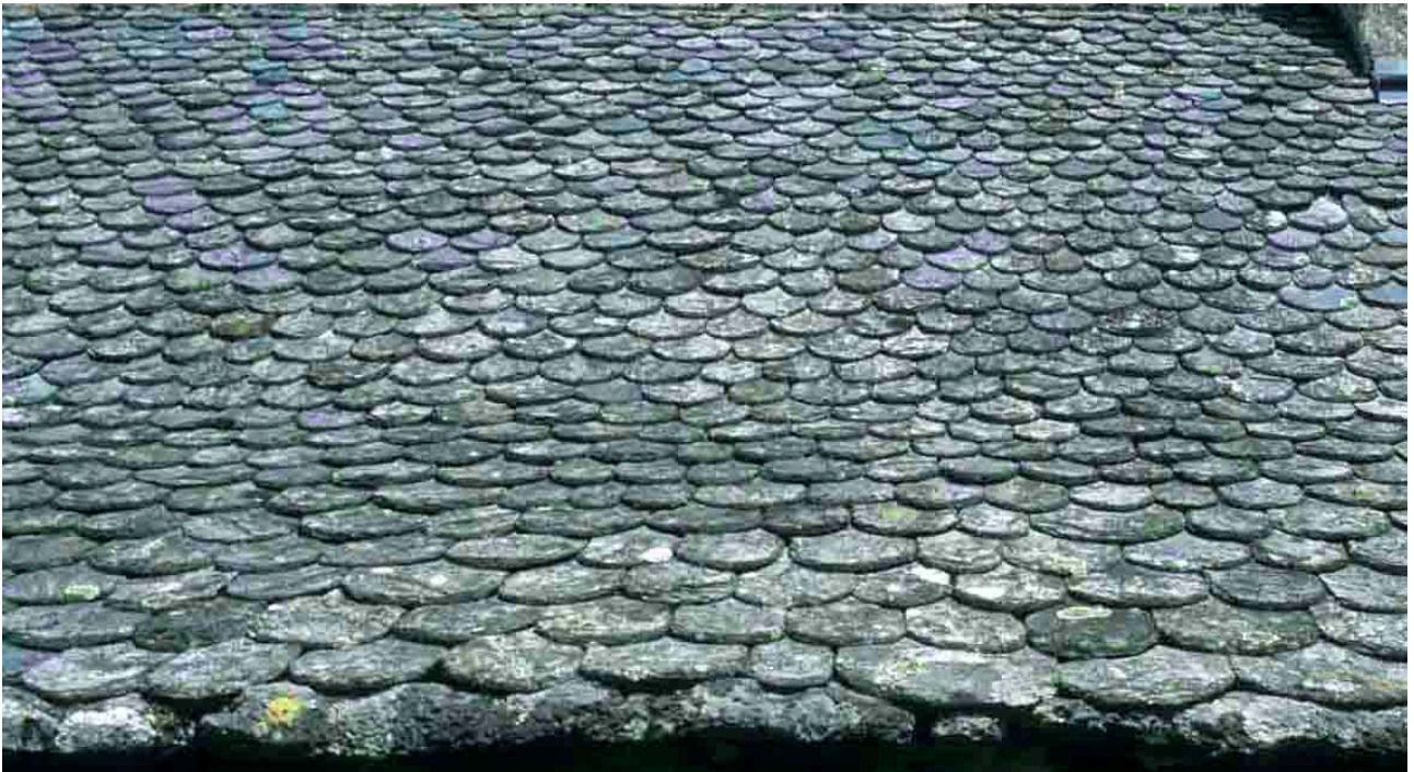
Cayrac (Aveyron), 2010, l'égout est porté par des lauzes de plus grande dimension.

En Lozère, la tête du mur est couronnée par une ou deux lauzes épaisses, scellées, faisant saillie sur le nu du mur.