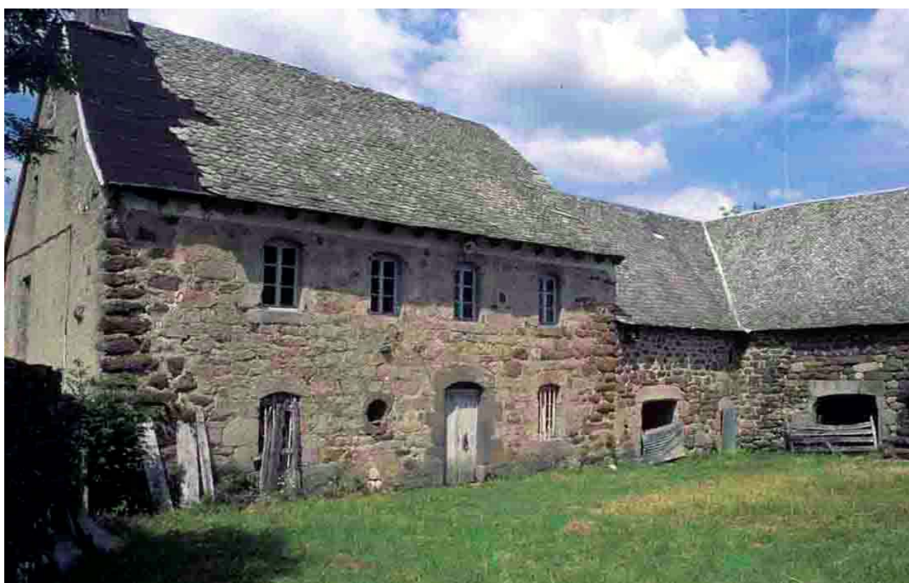
Cayrac (Aveyron), 2012.

D 260, transition au col de Saint-Pierre.