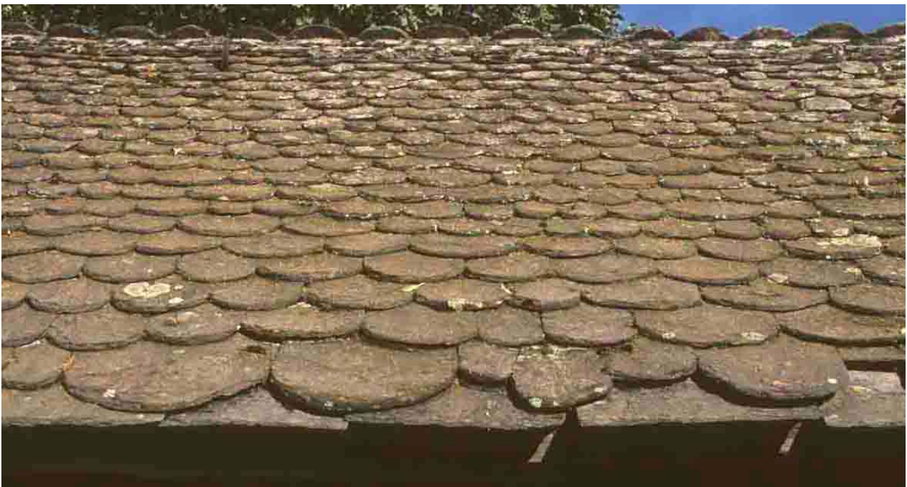
Le Bouchet (Lozère), 1979. l'égout est constitué de lauzes plates. Les lauzes sont ensuite clouées, de bas en haut, en grandeur décroissante.

Comptant parmi les plus réputés, le schiste de Lozère est un schiste argileux mat, morphique dont la couleur va du rouille au bleu avec une dominante grise, agrémenté de reflets de paillettes de mica, de reflets de quartz, de fer, de feldspath, et même de chlorite. Ces pierres font preuve d'une grande longévité et opposent une bonne résistance au gel. C'était souvent les gardiens de troupeaux qui exploitaient de petites carrières à heures perdues, pour leur propre consommation ou les besoins d'un marché local. De ces nombreux lieux d'extraction, il ne reste plus guère que la carrière de Lachamp, dont les couches proches de la surface produisent des lauzes tendres, et les couches profondes offrent des lauzes plus dures dont les coloris varient du gris acier au gris mordoré.