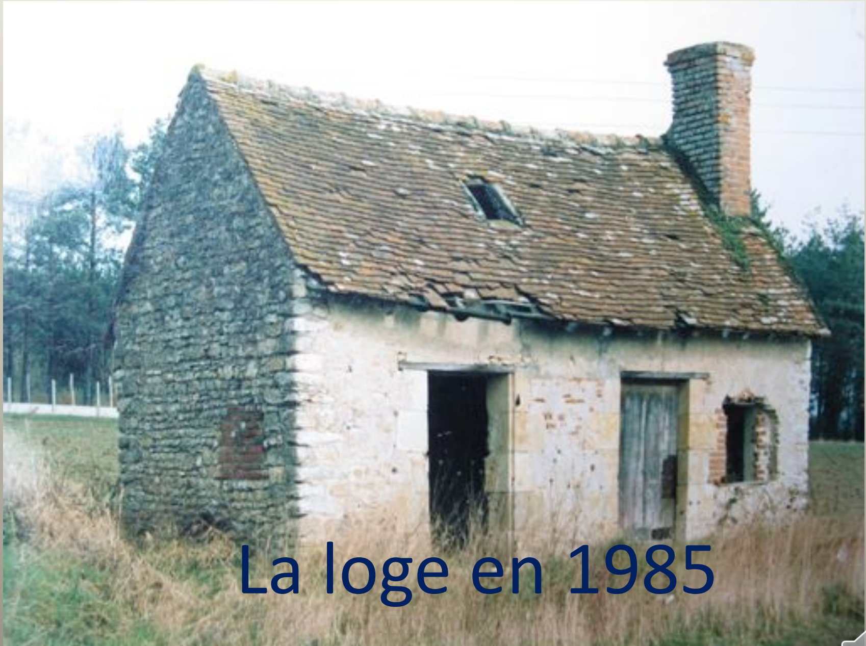
La loge en 1985